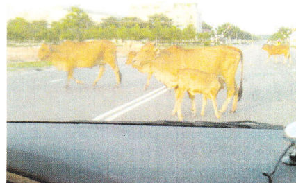
道路横断中、子牛は夢中 走行中に、これにぶつかったらダメージは???