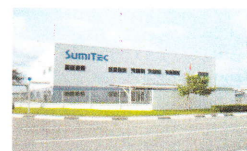
SUMITEC VIETNAM CO.,LTD

氏名 鼠 出身地 Sumitec 敷地内 年齢 不明 性別 確認しなかった 罪状 器物損壊 エアコンの電源ケーブルを切断し(食いちぎり) 設計室のエアコンを3日間止めた 判決 死刑 即日速やかに執行される