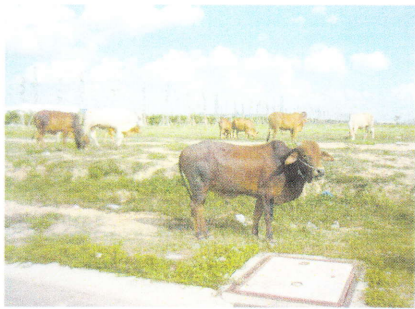
雨季に入り、彼らは喜んでいるのでは??? SUMITEC VIETNAM からの距離は約200m

近年、急速に開発が進められている Binh Duong 省ですが、一歩工業団地の外に出ると、こんな場面に遭遇します。