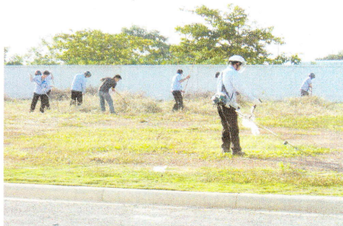
草刈機、棒を使っている作業 作業者は安全の為、バイク用ヘルメットのバイザーを降ろして作業