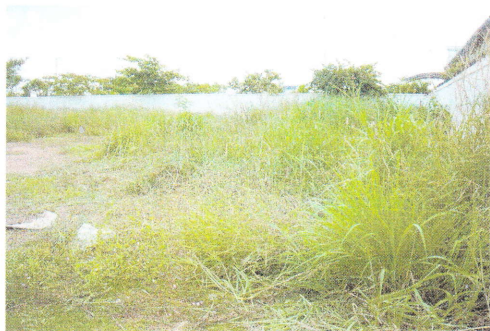
作業前：約1年間手付かずの状態 ブッシュになっている物もあった

日本は入梅したようですが、ベトナム南部は雨季に入りました。雨季になると雑草が良く育ちます。工場裏の空き地ですが、有効利用を考え草刈を行いました。今やらなければ、今後は更に大変になると考えられ、実施しました。